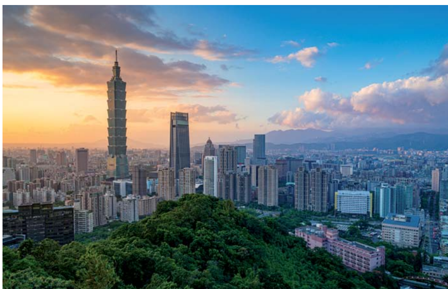
Taipeh, die Hauptstadt von Taiwan, ist eine moderne Metropole. Die Skyline wird von dem 509 m hohen, einem Bambusrohr ähnelnden Wolkenkratzer Taipei 101 dominiert.

Bereits am 20. Januar 2020 kam ein Krisenstab mit weitreichenden Befugnissen unter Leitung des Gesundheitsministers zusammen. Das frühe Abriegeln der Grenze für den Personenverkehr – gerade auch der zu Festland-China – ist einer der wichtigsten Gründe, warum es in Taiwan so gut wie keine Corona-Ausbrüche gegeben hat. Fabriken und Geschäfte blieben auch nach dem globalen Grassieren des