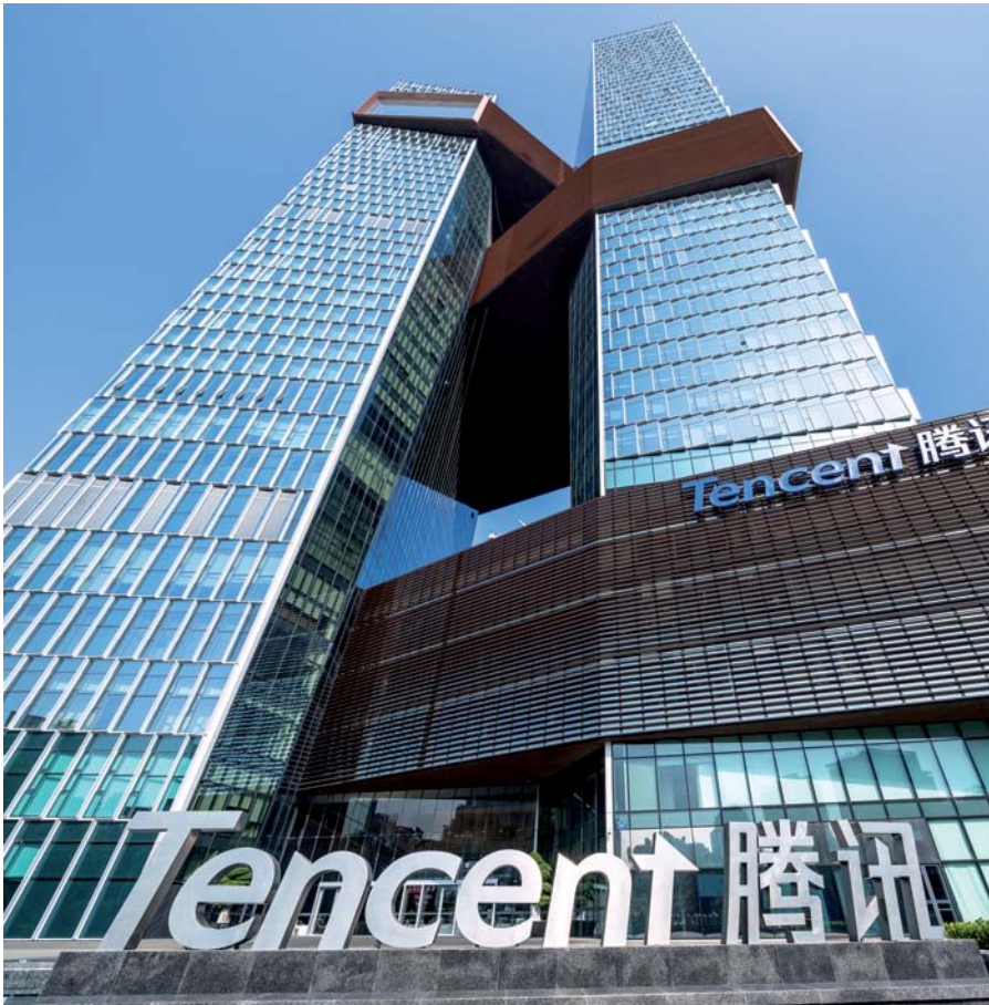
Was in der westlichen Welt Dienste wie WhatsApp sind, ist in China WeChat. Der Mutterkonzern Tencent gehört inzwischen zu den fünf wertvollsten Unternehmen der Welt.

Für formelle Onlinemeetings und Webinare zwischen Deutschland und China setzen Firmen häufig Plattformen ein, die sich auch in Deutschland schon bewährt haben, wie etwa Microsoft Teams, Webex oder GoToMeeting. Allerdings klagen Nutzer in der Volksrepublik über teilweise instabile Internetverbindungen, was häufig am Hosten der Konferenzen außerhalb Chinas liegt.