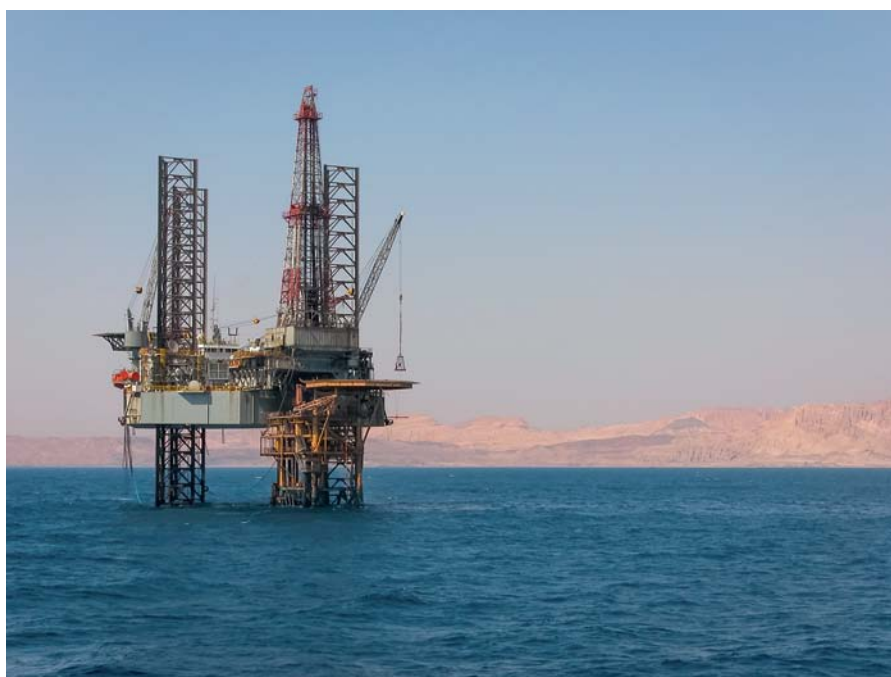
Im Golf von Suez gibt es eine große Zahl von Ölförderplattformen. Ägypten fördert mittlerweile mehr Gas als der heimische Markt benötigt und baut deshalb auch die Exportinfrastruktur aus.

des Wassers. Exportschlager sind Orangen, Zwiebeln und Trauben, die zu einem großen Teil nach Europa ausgeführt werden. Den gleichen Weg gehen auch immer mehr Süßkartoffeln. Im großen Stil importiert wird Getreide, allen voran aus der Schwarzmeerregion.