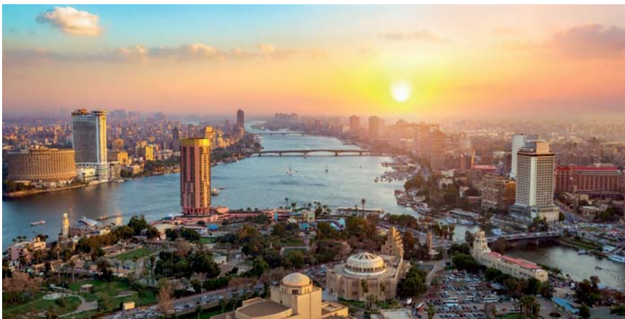
Kairo, die Stadt am Nil, ist das politische, wirtschaftliche und kulturelle Zentrum Ägyptens und gleichzeitig auch der Arabischen Welt.

Berühmte Zeitzeugen im Unterlauf sind die großen Pyramiden und die Sphinx von Gizeh bei Kairo. Die Hauptstadt ist auch die Schlagader des Landes. Tradition und Moderne liegen rund um den Tahrir-Platz so eng beieinander wie sonst kaum nirgends auf der Welt. Doch in puncto Städtebau hat Kairo viele Schwachstellen. So wird seit 2015 rund 50 Kilometer entfernt eine neue Hauptstadt für bis zu 15 Millionen Einwohner aus dem Boden gestampft – mit einem Volumen von rund 60 Milliarden US-Dollar.