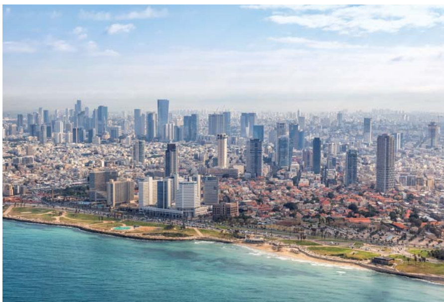
Die Skyline von Tel Aviv: Das Hightech- und Finanzzentrum Israels wurde kürzlich vom Magazin „The Economist“ zur teuersten Stadt der Welt gekürt – noch vor New York.

Doch es ist nicht alles Gold, was im Staate Israel wirtschaftlich glänzt. Das am Mittelmeer gelegene Hightech- und Finanzzentrum Tel Aviv wurde kürzlich vom Magazin „The Economist“ zur teuersten Stadt der Welt gekürt – vor New York, Paris, London und Zürich. Die Mittelmeer-Metropole ist international so stark vernetzt wie keine andere Stadt. Regelrecht explodiert sind in Tel Aviv, aber auch andernorts in Israel, die Wohnkosten. Sie schnellten seit dem Jahr 2010 landesweit um ein Drittel empor. Anders als in den 1990er Jahren, als rund 1 Million Einwanderer aus der vormaligen Sowjetunion nach Israel kamen, forciert der Staat derzeit keine Wohnprojekte im großen Stil.