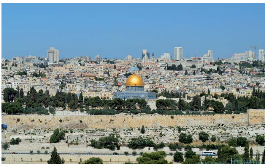
Jerusalem liegt zwischen dem Mittelmeer und dem Toten Meer. In der Stadt befinden sich der Sitz des Präsidenten, der Legislative, der Judikative und der Exekutive des Staates Israel.

beträgt rund 50.000 US-Dollar. Nahezu gleichauf tragen Industrie (24,3%) sowie die Informations- und Kommunikationstechnik (22,4%) mehr als 20% zum BIP bei. Doch auch die Bereiche Wissenschaft und Technik (14,7%) sowie die Finanzdienstleistungen (14,0%) sind stark. Der Wachstumsmotor des Landes ist der Hightech-Sektor, der rund 10% der Arbeitsplätze stellt und etwa für die Hälfte aller Ausfuhren verantwortlich zeichnet.